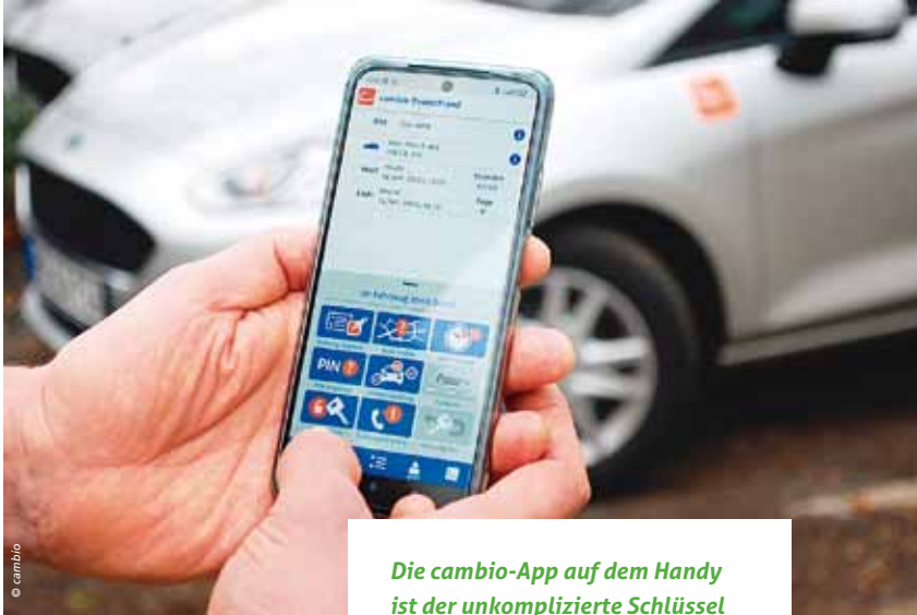
Die cambio-App auf dem Handy ist der unkomplizierte Schlüssel zum Leihwagen.

Buchen, an der Station abholen, einfach losfahren ohne laufende Kosten. Stationsbasiertes CarSharing ist eine kostengünstige Alternative vor allem zum Zweit- oder gar Drittwagen.