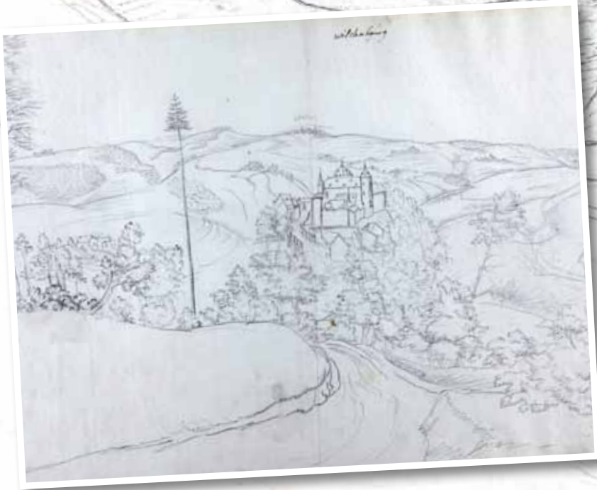
kleine Abb. 1: Die Zeichnung der Burg von Osten mit dem kuriosen Nadelbaum kann spätestens 1717 entstanden sein.

Vor 300 Jahren durchstreifte der wallonische Zeichner Renier Roidkin mit seinem Skizzenbuch die Nordeifel. Dabei zeichnete er mehrfach die Wildenburg. Der Manscheider Historiker Manfred Konrads weiß vieles dazu zu berichten.