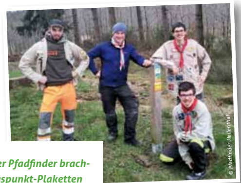
Die Hellenthaler Pfadfinder brachten die Rettungspunkt-Plaketten an den Wegweiserpfosten an.

Auf der Plakette befinden sich Buchstaben und Nummern, z.B. Hel-11411 oder Hel-12204, die im Notfall bei einem Anruf unter 112 durchgegeben werden. Sowohl die Leitstelle als auch der Rettungsdienst können durch diese Ziffernfolge den Standort ermitteln und auf direktem und schnellstem Weg zur Hilfe eilen.