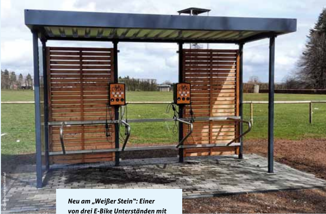
Neu am „Weißer Stein“: Einer von drei E-Bike Unterständen mit Ladestation in Hellenthal – nicht nur für Touristen.

le Klimaschutzinvestitionen zur Verfügung gestellt. Die Verwaltung der Gemeinde Hellenthal hat sich für eine Maßnahme im Bereich klimafreundliche Mobilität entschieden. Der E-Bike-Verkehr nimmt zu, gerade im Tourismus spielt er eine zunehmend wichtige Rolle. Schließlich wurde nach Antragstellung am 02.06.2022 nur einen Tag später (!) ein Betrag in Höhe von 78.335,52 € bewilligt. Die Verwaltung hat daraufhin den Auftrag zur Errichtung der drei Fahrradunterstände an folgenden Standorten vergeben: