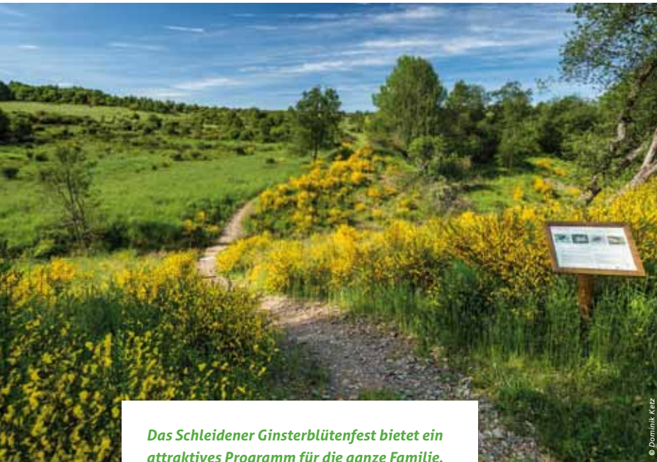
Das Schleidener Ginsterblütenfest bietet ein attraktives Programm für die ganze Familie.

Am 20. und 21. Mai 2023 findet das Fest zur Ginsterblüte, dem Europäischen Tag der Parke und dem 20-jährigen Bestehen des Fördervereins Nationalpark in Dreiborn und auf der Dreiborner Hochfläche statt.